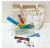
個人持ち画材セット 画材などは予告なく変更する場合があります。

「ご利用明細(振込の受取書)」もしくは「入金証明となる書類」は下記の3点が確認できるものをご持参ください。