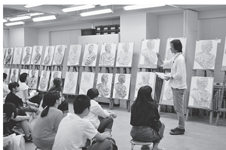
コンクール講評風景