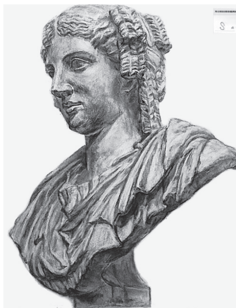
昨年度コンクール優秀作品

河合塾美術研究所では、毎年「基礎専攻高1・2専科」から始めた塾生が、現役で東京芸大を始め、主要私大に多数合格しています。