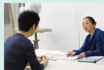
面談 希望者には進 路相談から学 習の仕方まで、 丁寧に説明し ます。