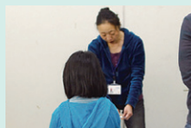
ガイダンス 道具の使い方 から描き方まで、 丁寧にアドバイ スします。