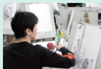
制作・ 個別指導 一人ひとりのよ さを見据えた、 的確な指導を します。