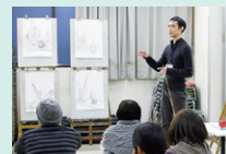
講評 今日の成果を 並べて、一人 ずつ解説して いきます。