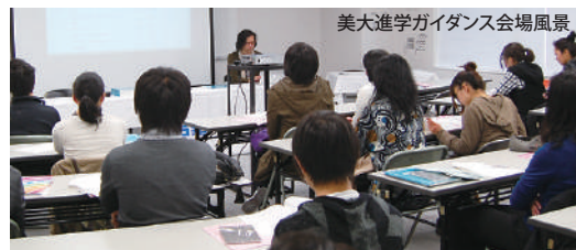
美大進学ガイダンス会場風景