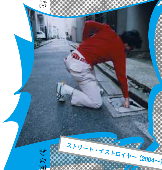
ストリート・デストロイヤー (2004~)

受賞をはじめ、美術手帖での連載「やっつけメーカー」 じっくりに見て味わってください。見なきや分らない、見て