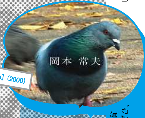
ハト命名 [movie] (2000)