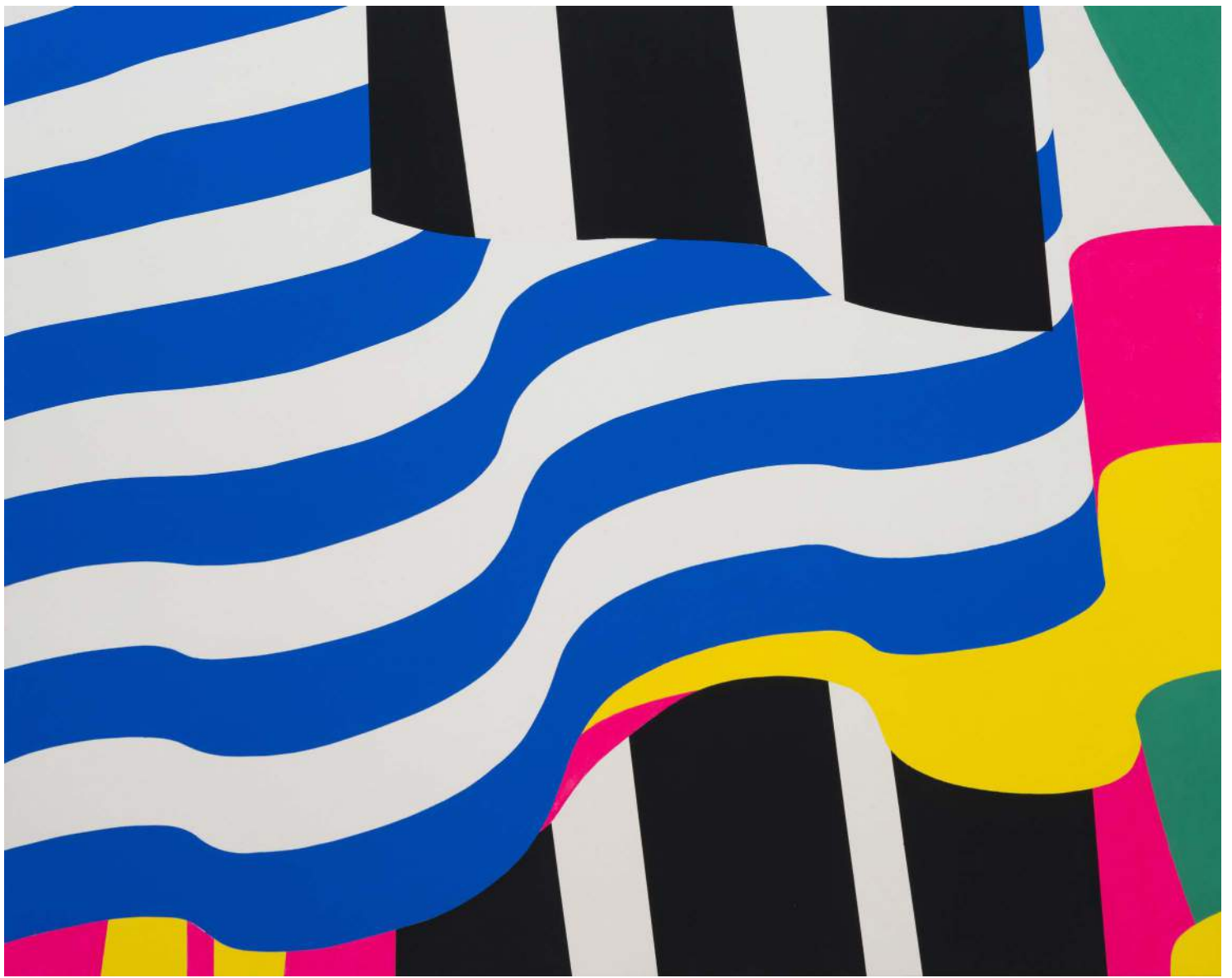
untitled, 2012, acrylic on canvas, 92 x 115 cm