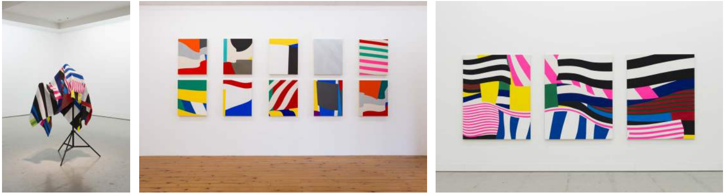
( 上段左から ) untitled, 2014, acrylic on canvas, 92 x 73.5 cm / untitled, 2015, acrylic on canvas, 144 x 115 cm / untitled, 2015, acrylic on canvas, 144 x 115 cm / untitled, 2013, ribbons and wood, 10.5 x 11.5 x 3 cm / ( 下段左から ) untitled, 2013-14, polyester size variable / Installation view of "color / form" , HAGIWARA PROJECTS, Tokyo, 2014 / untitled, 2013, acrylic on canvas, 180 x 492 cm